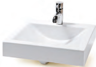
Vasque sur plan et robinetterie de chez Léopold Bouchard.