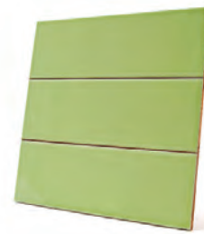
Céramique de chez Céramique Décor.